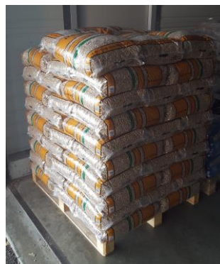
Palettes de 77 sacs 100 x 120 x 160 cm